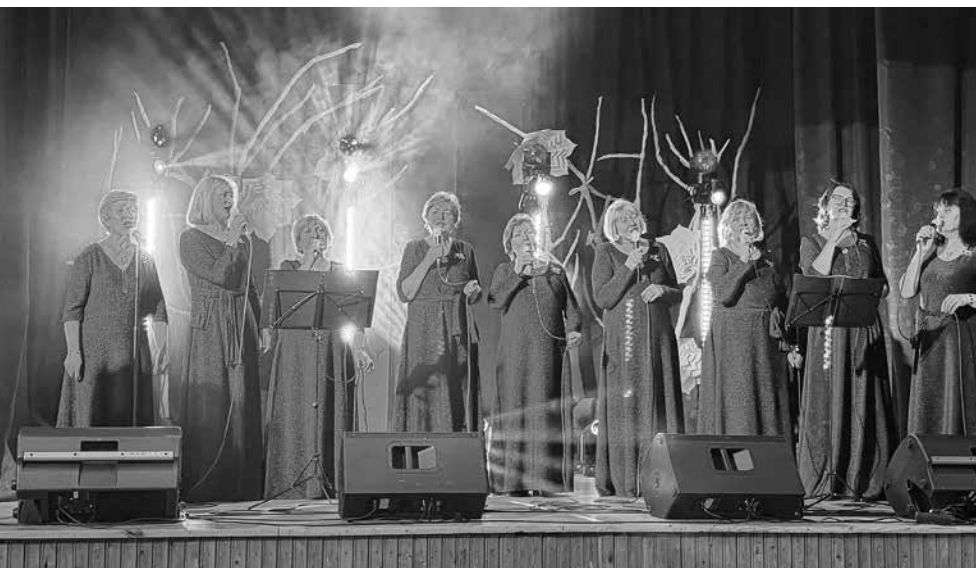
Ansamblis „Nevėžio vingis“ šventiniame koncerte.