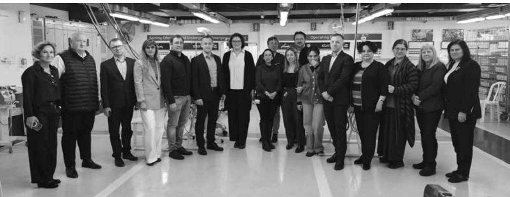
Lietuvos delegacija Izraelyje