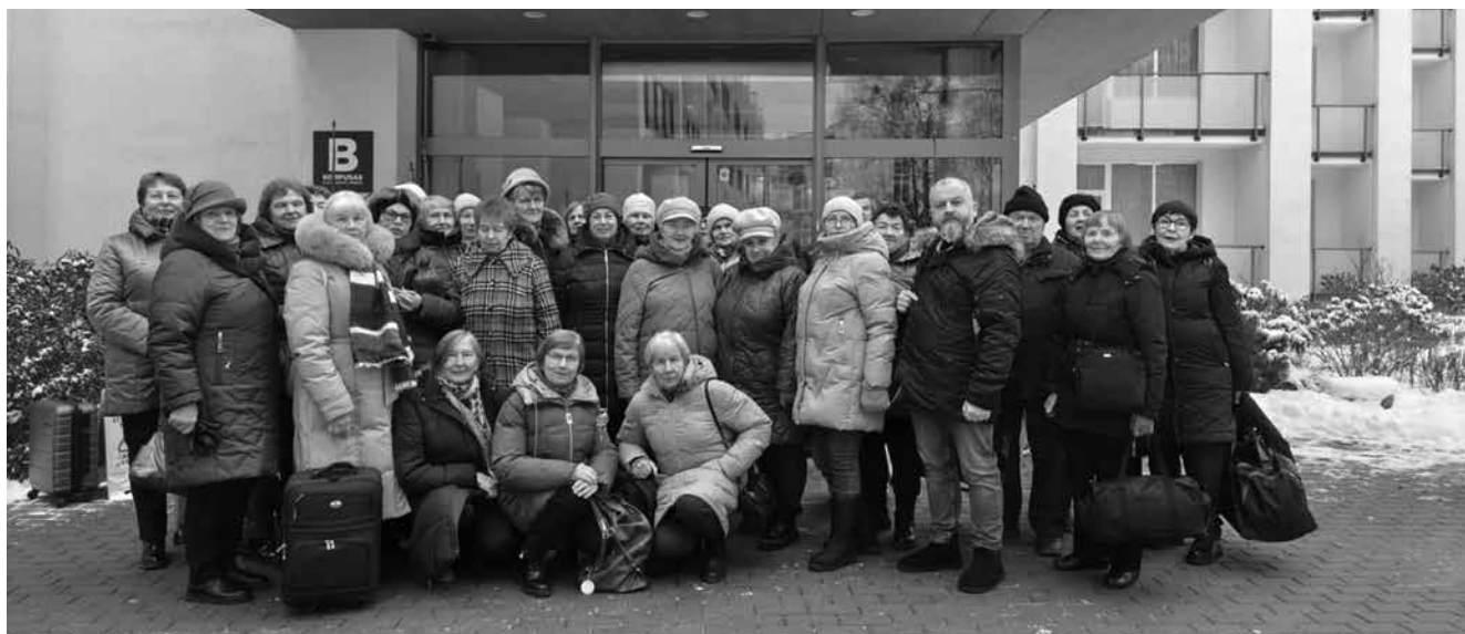
Išvyka į Druskininkų „Eglės“ sanatoriją

Dar daug daug visokių nematyty ir neregėty dalykų išmėginome. Vieni kitus tik trumpam pamatome, pasidžiaugiame, kad dar gyvi, ir tokius lapelius su tais gydytojų užrašymais pasičiupe iš kabineto į kabinetą skubinamės. O valgykloje – skanėsty visokiausių prisi valgėme! Vieni su kitais ilgam susitikome tik tada, kai surinko mus namo vežti. Visi – linksmi, jspūdžiai – nepakartojami. Grįžtant rimtai ir vieningai nutarėme ilgai nebelaukti ir po kelių mėnesių vėl formuoti savo klubo tarybą. Pasiilgstame vieni kitų, taip gera bendrystėje: kartu gyvename, kartu valgome, kartu gydome, kartu džiaugiamės. Mums nesvarbu, kur važiuoti, kad tik kartu. Dabar yra madinga pasirašyti va taip: anonimas. Bet