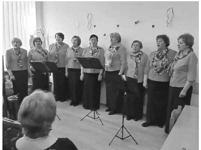
Dainuoja ansamblis „Velžynėlis“.