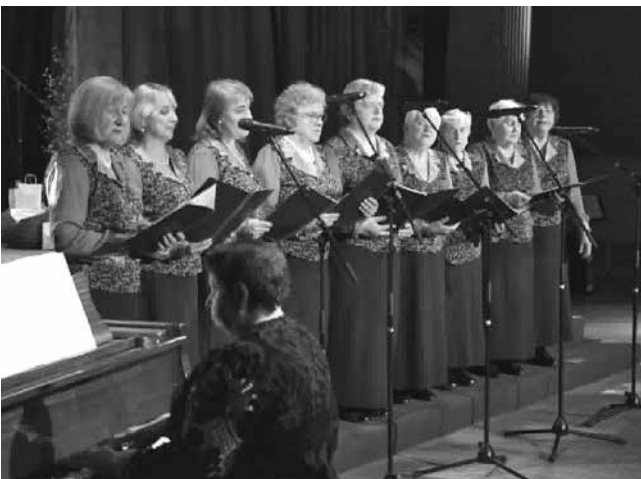
Koncertuoja ARA „Artritas“ vokalinis ansamblis „Vakarė“.

Balandžio 29 d. buvome pakviestos į Panevėžio kultūros centro rengiamą meno mėgėjų kolektyvų sambūrį „Mes laiko tėkmėj“. Mėgėjų menas nėra tik laisvalaikis, tai yra sąmoninga, kryptinga kūrybinė veikla,