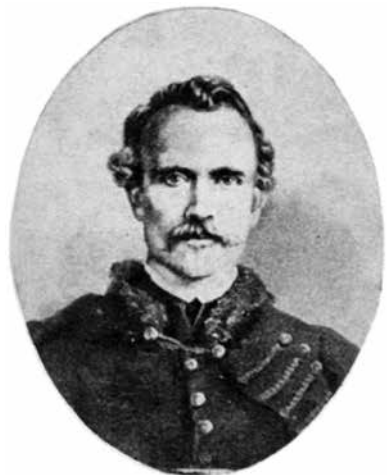
Zigmantas Sierakauskas (1826 05 30 Lisovas, Voluinės sritis – 1863 06 27 Vilnius) – vienas 1863 metų sukilimo vadovų

Laisvės kovos vyko Rusijos imperijos okupuotose Lenkijoje ir Lietuvos Didžiojoje Kunigaikštystėje bei jų etnografinėse dalyse – Baltarusijoje ir Ukrainoje.