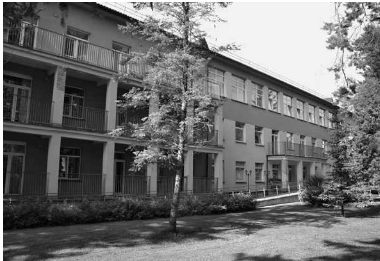
Likėnų reabilitacijos ligoninės pastatas, Biržų r. VIKIPEDIJA nuotr.

Po ilgai trukusių derybų ir sunkaus darbo 2023 m. vasario 1 d. Likėnų purvas sugrįžo į VšĮ Respublikinės Panevėžio ligoninės filialą – Likėnų reabilitacijos ligoni-