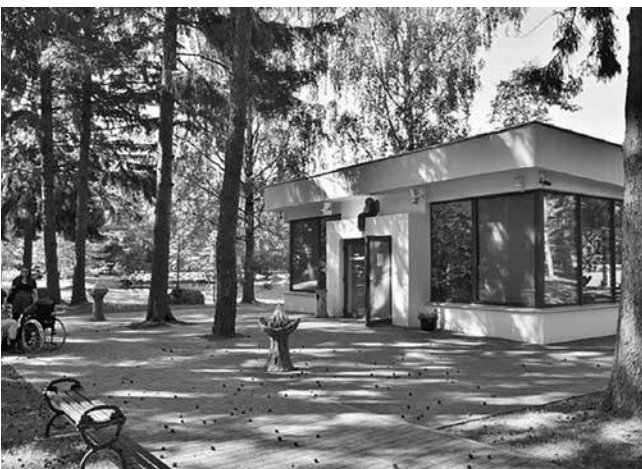
Likėnų mineralinio vandens biuветė.