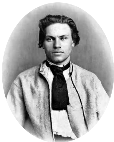
Konstantinas Kalinauskas (1838 02 02 Mastaulėnai, Gardino sritis – 1864 03 22 Vilnius) – vienas 1863 metų sukilimo vadovų

1863–1864 metų sukilimas (1863 m. sausio 22 d. – 1864 m. birželio 18 d.) – buvusios Lietuvos Didžiosios Kunigaikštystės ir Lenkijos karalystės tautų išsivadavimo iš Rusijos imperijos sukilimas. Lenkijoje jis vadinamas Sausio sukilimu.