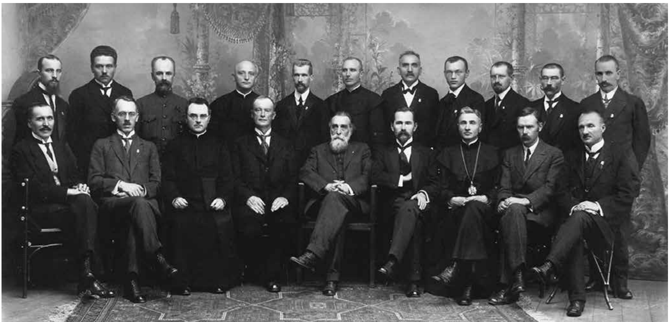
Lietuvos Tarybos nariai

Pirmasis pasaulinis karas sudarė palankias tarptautines aplinkybes ir pakoregavo Lietuvos geopolitinę situaciją savarankiškumo siekiams įgyvendinti. Jo metu buvo garsiau reikalauta autonomijos.